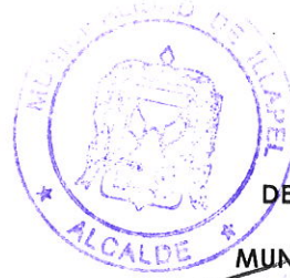
DENIS CORTES VARGAS ALCALDE MUNICIPALIDAD DE ILLAPEL

Adj.: Contrato de arrendamiento de inmueble ubicado en calle Santa Virginia Sin Número, Illapel, suscrito el día 22 de enero de 2016.